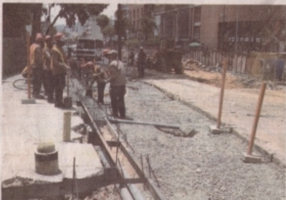
Se proyecta que 80 obreros trabajen en la construcción

Se trata de un elevador unidireccional con estructura de concreto, cuya longitud total será de 248 metros y dos canales. Los trabajos conllevan el cierre parcial del canal rápido de la avenida Victoria, por lo que efectivos de la Policía Nacional Bolivariana, monitorean el tránsito vehicular en la zona afectada. 1-10